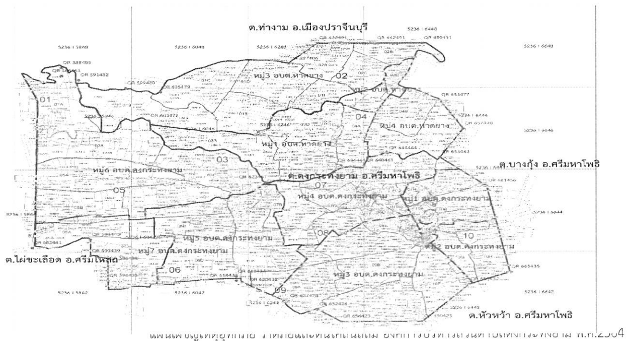
ภาพที่ 1 : แผนที่อาณาเขตองค์การบริหารส่วนตำบลดงกระทยาม